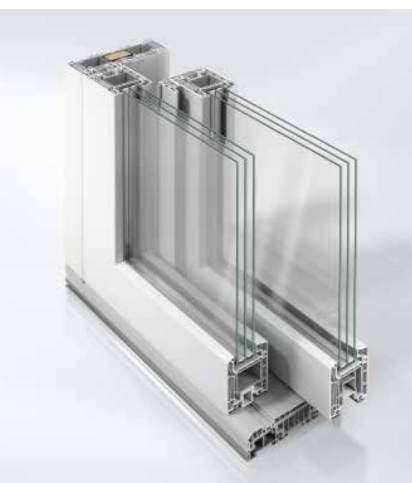
Schüco LivIngSlide : Une liberté de conception maximale avec une qualité convaincante.